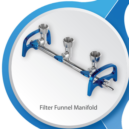
Filter Funnel Manifold