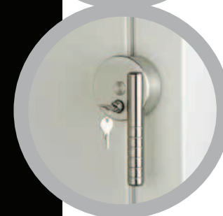
Ultrafreezer verticale Serratura con chiave (di serie) Upright Ultrafreezer Key Locking (standard)