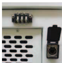
Contatti secchi e porta Ethernet Dry contacts and Ethernet port