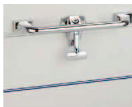
Ultrafreezer orizzontale Serratura con chiave (di serie) Chest Ultrafreezer Key Locking (standard)