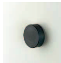
Foro passacavo mm 25 Pass-through hole mm 25