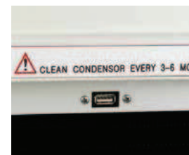
Porta USB frontale USB frontal port