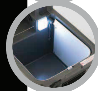
Illuminazione interna Internal light