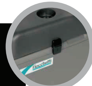
Chiusura di sicurezza con chiave Safety lock with key

The internal evaporator on three sides ensures adjustable temperatures between +10°C and -10°C for models C26 and C41, between +10°C and -20°C for C65 model.