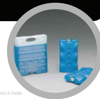
Accumulatori di freddo Ice packs