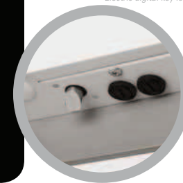
Serratura elettronica Electric digital key lock