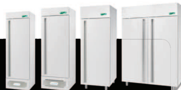
Labor 400 Labor 500 Labor 700 Labor 1500