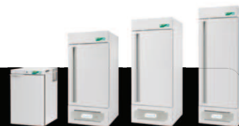
Labor 140 Labor 170 Labor 200 Labor 250

The professional refrigerators part of LABOR range features a stylish design with solid door and all-length door handle. They have been developed specifically for laboratory and hospital use, able to adapt to different needs thanks to the different offered capacities and the customization of the internal fittings.