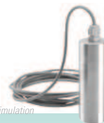
Simulatore di prodotto con sonda PT100 PT100 ballasted probe for temp. product simulation