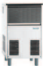
BF80A BF80W 70 Kg/24h 73 Kg/24h L 529 P 626 H 921