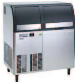
AF1206A AF1206W 200 Kg/24h L 950 P 864 H 1126