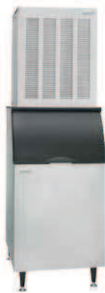
AF1822A AF1822W 288 Kg/24h L 560 P 864 H 1701