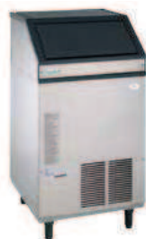
AF1103A 108 Kg/24h L 592 P 672 H 1126