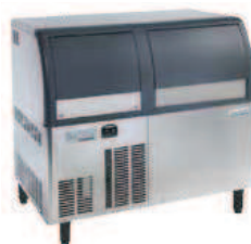
AF1124A AF1124W 120 Kg/24h L 950 P 655 H 915