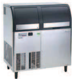
AF1156A AF1156W 155 Kg/24h L 950 P 655 H 1126